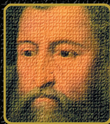
Simón el zelote